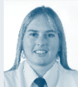
Monica Desmidt > Wijk Sint-Gillis

Hauwerstraat 3, 8000 Brugge, t 050 44 89 28, f 050 44 89 39, e centrum.politie@brugge.be Ma-Vr: 08.00-12.00 uur en van 13.30-17.00 uur Gesloten op zon- en feestdagen