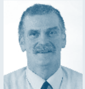
Wijk Kristus Koning (Stubbekwartier)