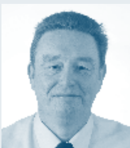
Philippe Guilini > Wijk Sint-Jozef/Koolkerke

Ma-Vr: 08.00-12.00 uur en van 13.30-17.00 uur Gesloten op zon- en feestdagen