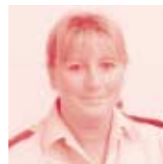
Wijk Dampoortkwartier Inp. Martine Mouquet