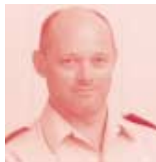
Wijk Maalse Steenweg Inp. Dirk Bogaert