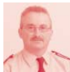
Wijk Lissewege/ Zwankendamme Inp. Dirk Dhondt