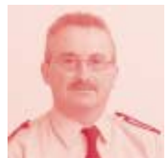
Wijk Lissewege/ Zwankendamme Inp Dirk Dhondt