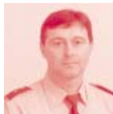
Wijk Strandwijk Inp Rudy Ryde

Marktplein 12, 8380 Zeebrugge, 050/47 29 35 Ma-vr : 08.00 – 12.00 uur en 13.30 – 17.00 uur (di tot 18.00 uur), za : 08.00 – 11.30 uur