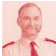
Wijk Sanderskwartier Inp. Eddy Denys