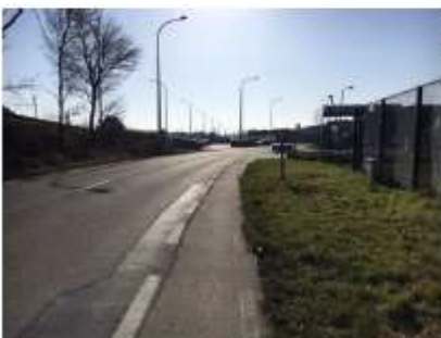
rechte door (de zijstraat Waggelwaterstraat) langs de Post