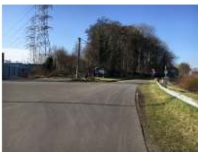
Houtkaai, hier naar links af te draaien