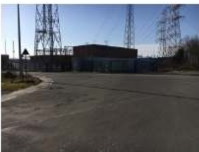
Langs de centrale