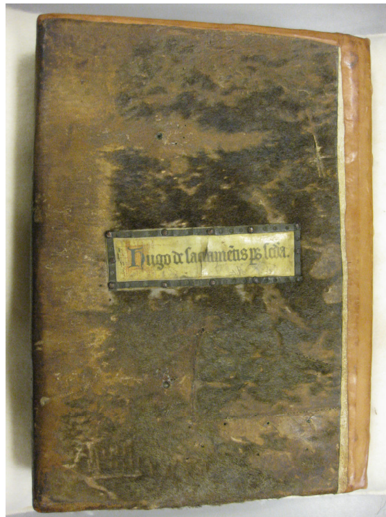
Gelieve extra voorzichtig om te gaan met de fenestrae op het achterplat van sommige manuscripten.