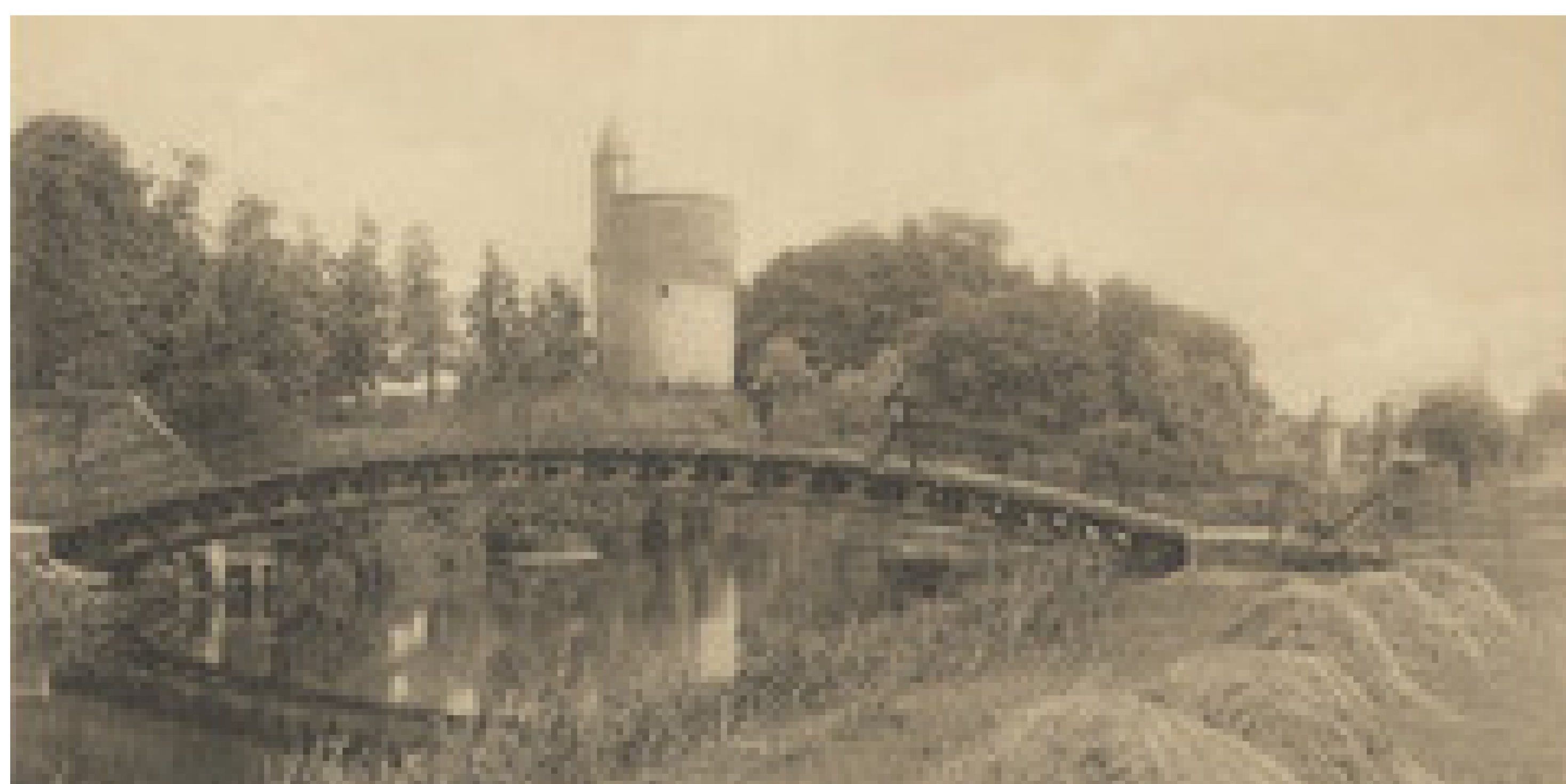
Loopbrug naar de Begijnenvest, 1918

In de gemeenteraad van 25 juli 1896 werd beslist om in het uitspringend gedeelte ten westen van de Minnewaterbrug een gedenkmonument te plaatsen voor de beeldhouwer Hendrik Pickery (1828-1894). Het monument, een werk van Pickery's zoon Gustaaf (1862-1921), werd ingehuldigd in 1901. De sokkel is een ontwerp van stadsarchitect Louis Delacenserie. Tot in 1918 bevond er zich een sierlijk ijzeren loopbrugje over de vestingen ter hoogte van het borstbeeld van Hendrik Pickery. Het werd door de wegtrekkende Duitse troepen vernield en nooit heropgebouwd.