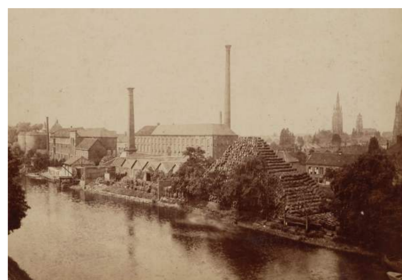
Jeneverstokerij op de Boninvest met de gestapelde tonnen langs de vest (1885) Bron: Stadsarchief Brugge FO/E/0034, vervaardiger Le Bon Oostende