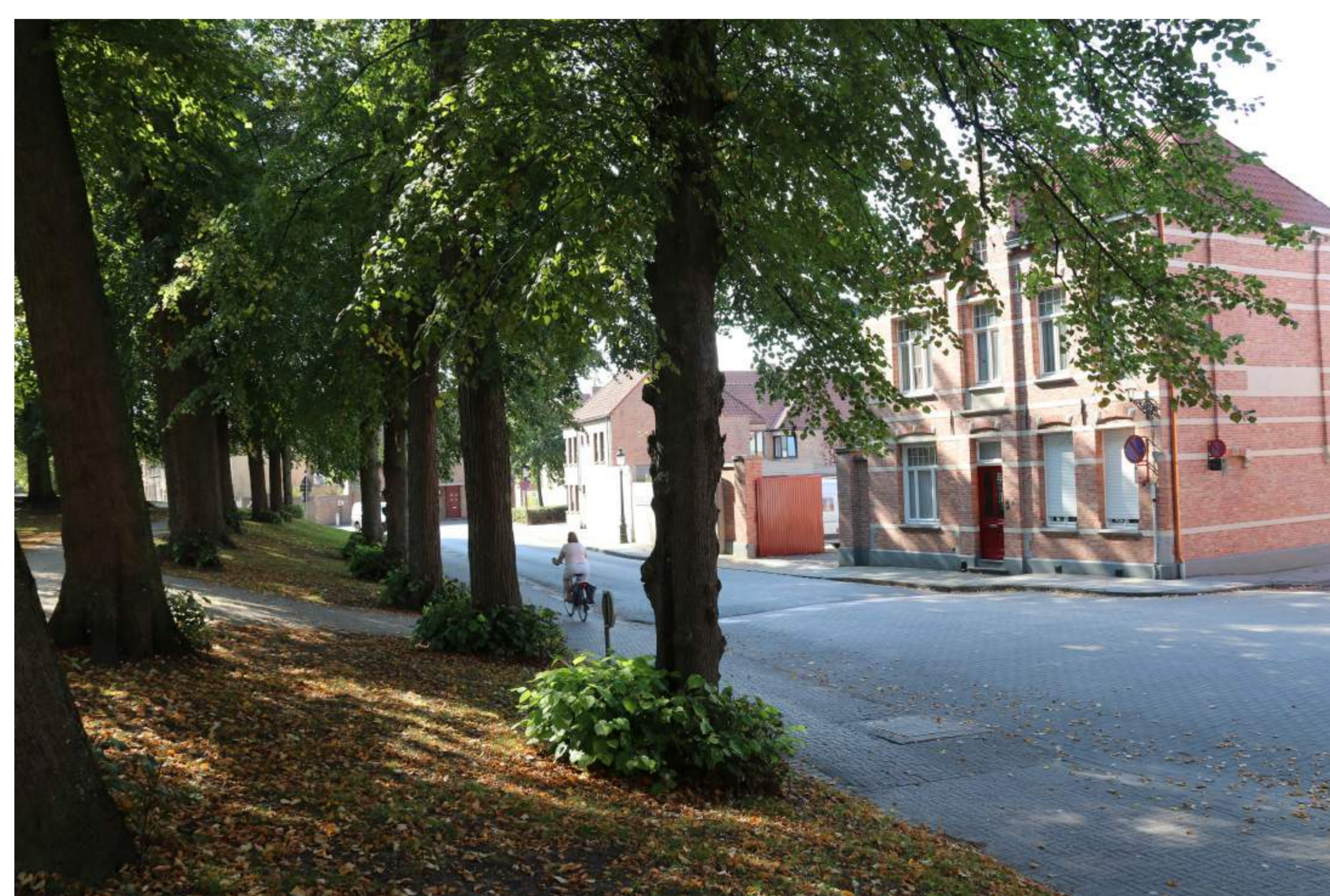
De linden van de Gentpoortvest werden geplant in 1856. Momenteel resteren er nog 67 zomerlinden en 3 winterlinden van de 169 die er destijds geplant werden.

Niet iedereen ging echter akkoord met die bestemming. Sommigen hadden liever de aanleg van een boulevard gezien. Ook vond men dat dit te zware financiële lasten met zich zou meebrengen en dat er genoeg andere werken waren waaraan het stadsgeld nuttig kon besteed worden, bijvoorbeeld aan de bestrijding van de armoede. Hierop werd echter gerepliceerd dat het beste middel om de armen te helpen erin bestond hen werk en inkomen te verschaffen. De aanleg van een 'publieke wandeling' kon daartoe zeker een bijdrage leveren. En zo werden dan uiteindelijk de eerste stappen hiervoor gezet.