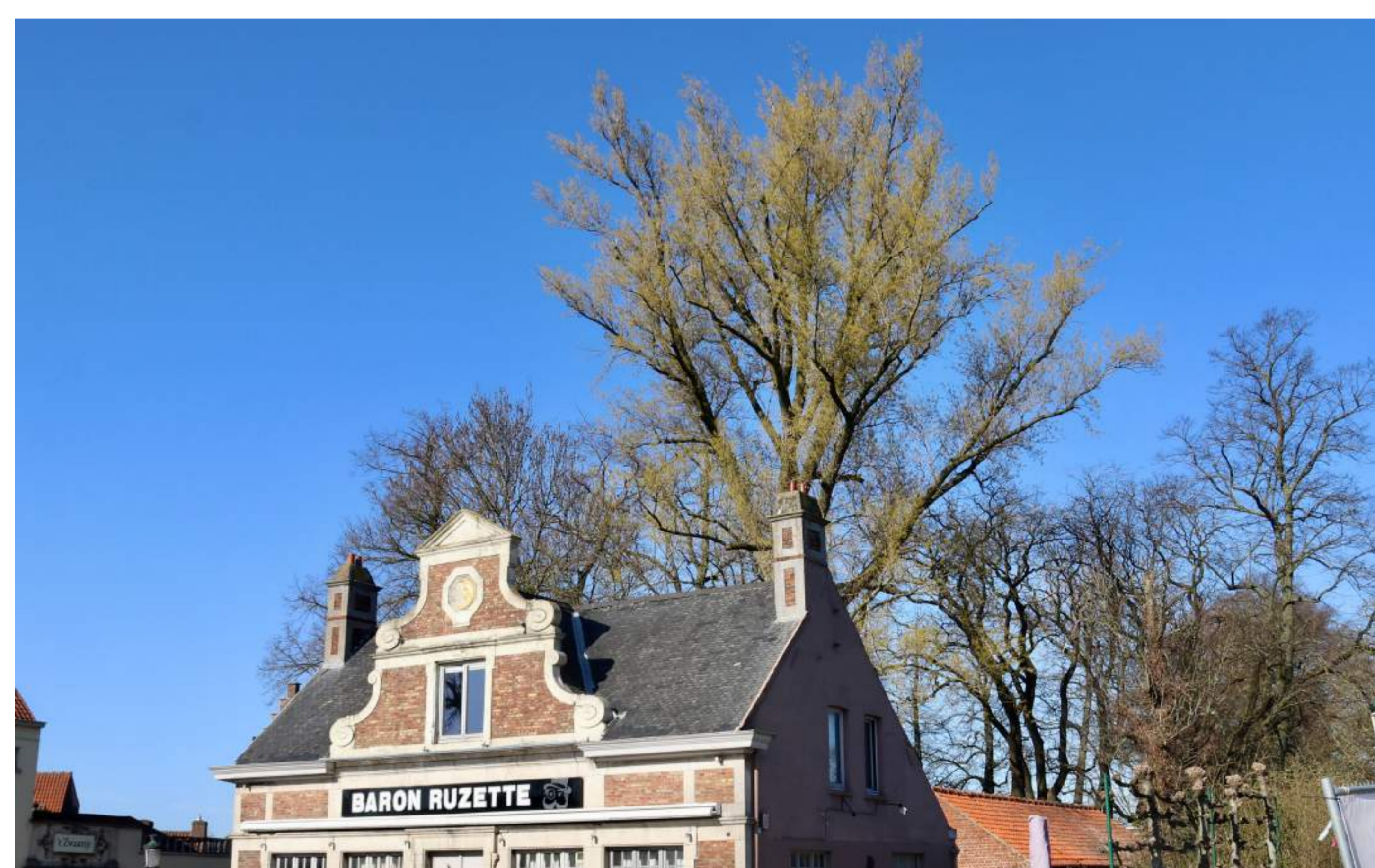
Zwarte populier (Populus nigra) op de Gentpoortvest. De boom werd vermoedelijk geplant in 1856 of mogelijk nog iets vroeger. De stamomtrek bedraagt actueel 510 cm.