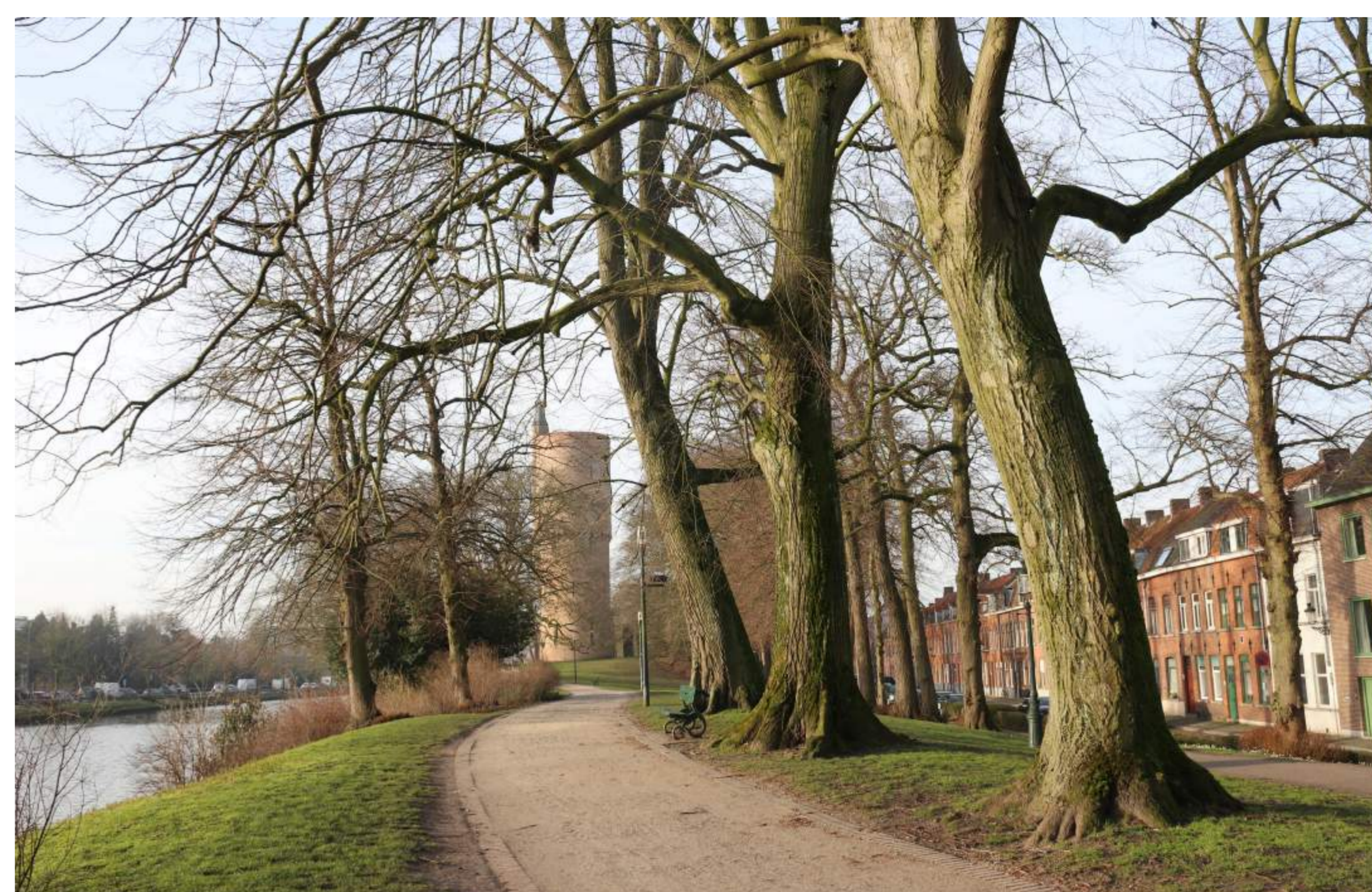
De drie zilverlinden-vredesbomen, in 1928 geplant op de Gentpoortvest. Foto: Arnout Zwaenepoel, februari 2021

De zilverlinden hebben stamomtrekken van 360 cm, wat aanzienlijk meer is dan de oudere zomerlinden langs de straatrand. De drie vredesbomen hebben veel meer plaats en zilverlinden groeien ook sneller dan zomerlinden.