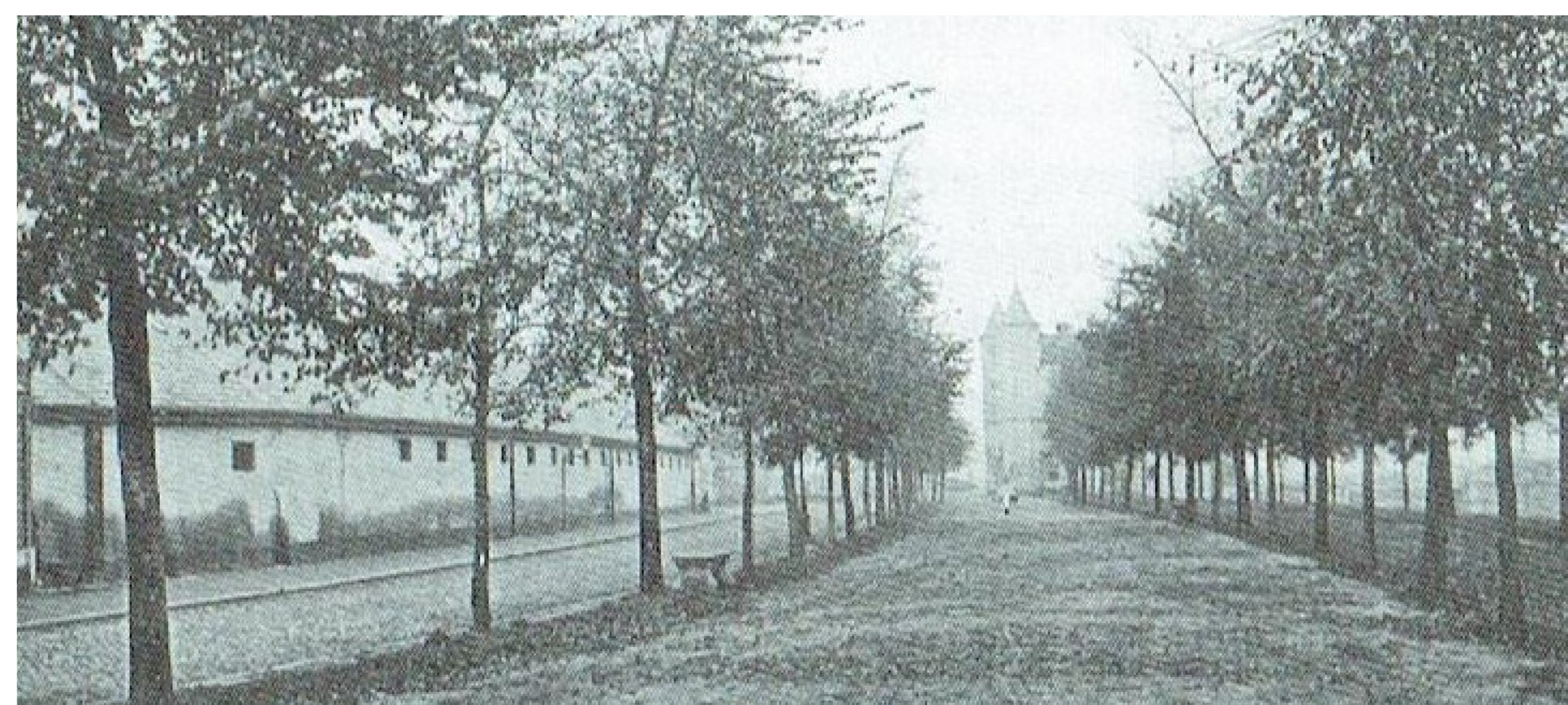
De Kazernevest vanaf de Vuldersstraat tot de Kruispoort, eind 19de eeuw. Links de lange muur van de Poermolenkazerne, opgetrokken in 1891. De brede stadswandeling is afgezoomd met twee parallelle bomenrijen.