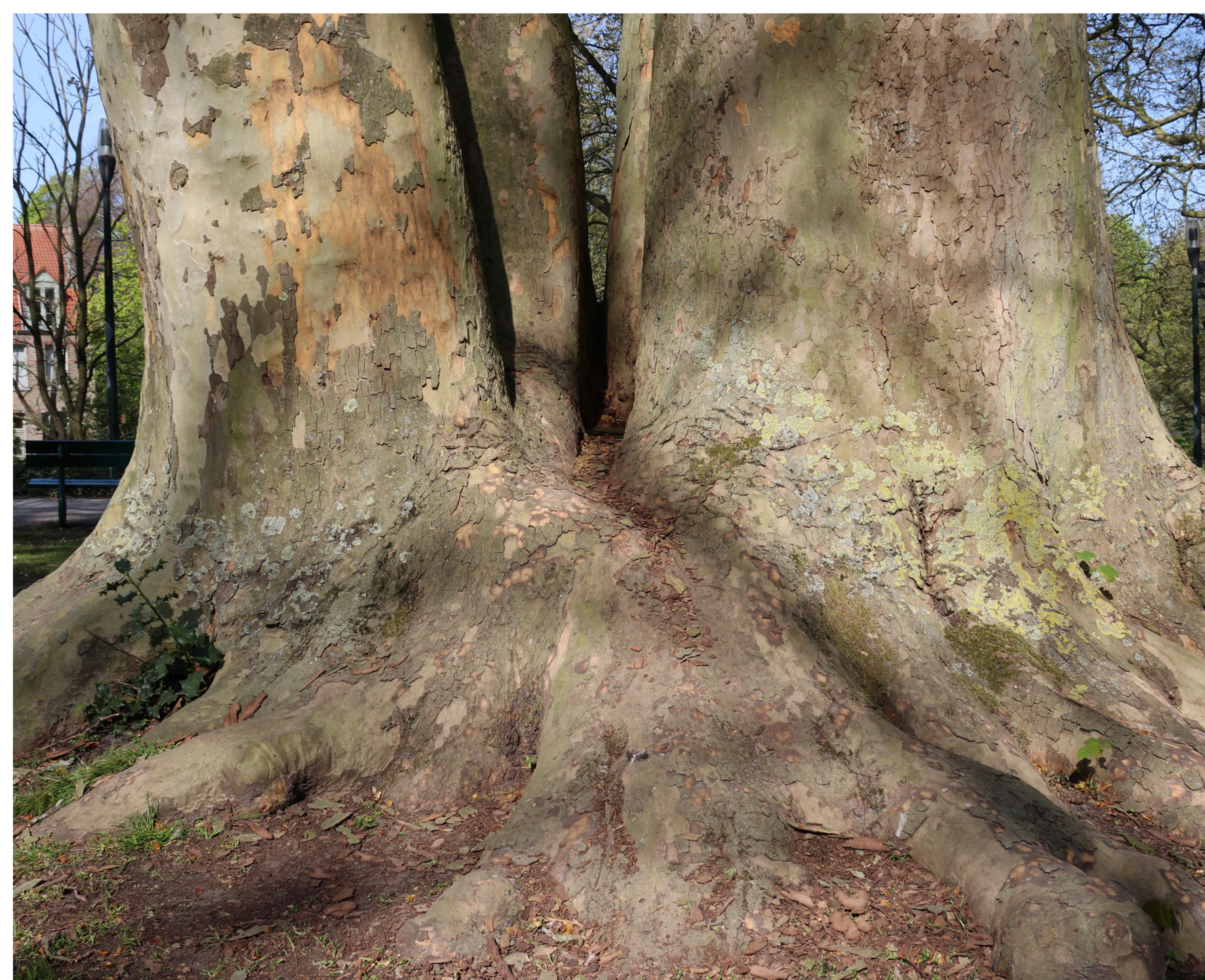
Vierstammige gewone plataan aan de Boeverievest.

Wellicht wilden de vroegere landschapsarchitecten Rosseels en Van Hulle wel oosterse platanen, maar konden ze die niet te pakken krijgen en werden er telkens gewone platanen geplant. Moeilijk te benoemen soorten als wilgen, olmen, meidoorns en linden werden vaak niet met een soortnaam aangeduid maar met de naam van hun familie (bijvoorbeeld de wilgenfamilie is aangeduid als Salix spec. )