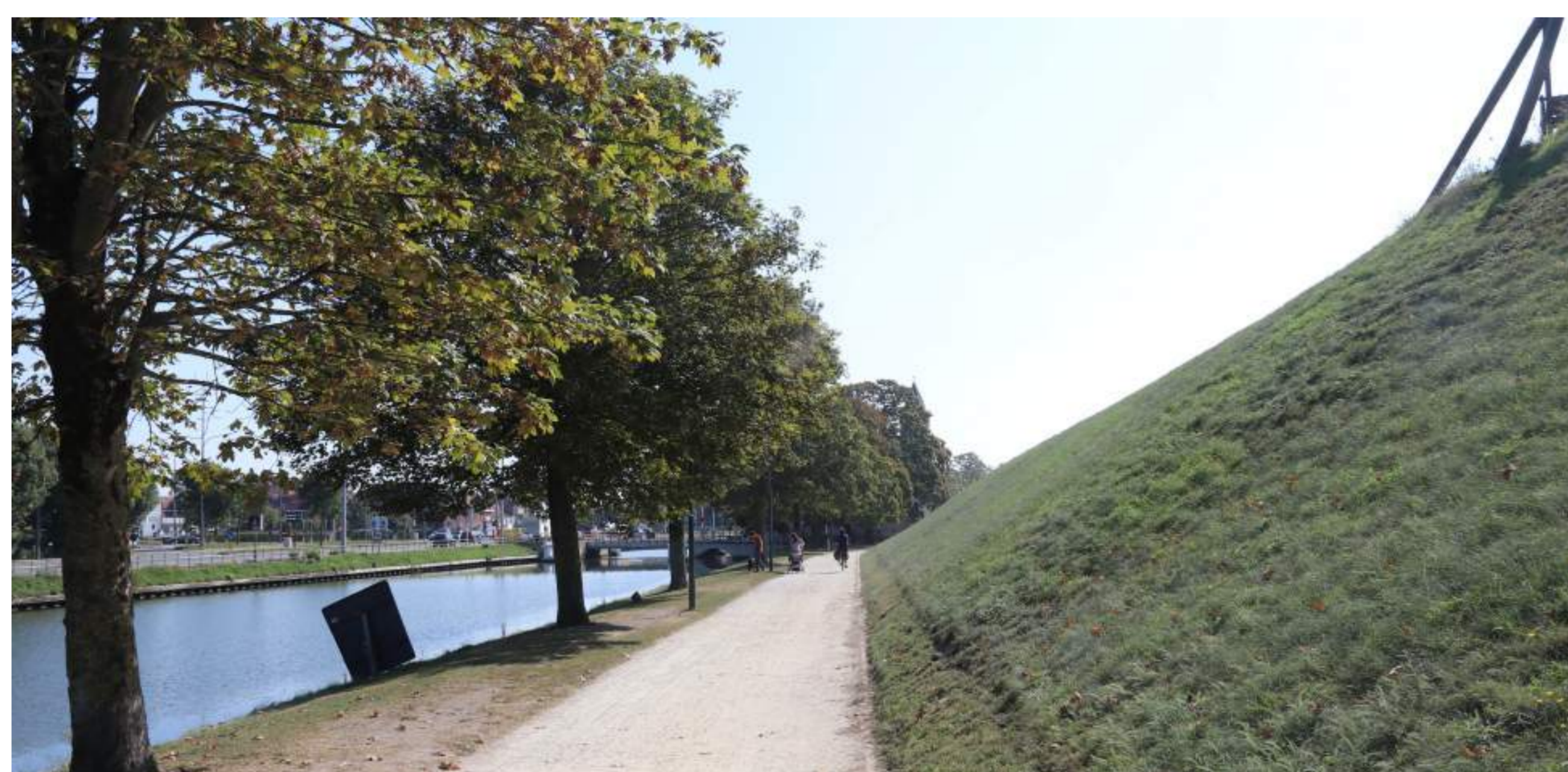
Tot 1989 bleef dit gedeelte van de Ringvaart-Kruisvest niet beplant. In 1989 werden ook hier esdoorns geplant. De eerste foto dateert van 1985, de tweede van 2020.