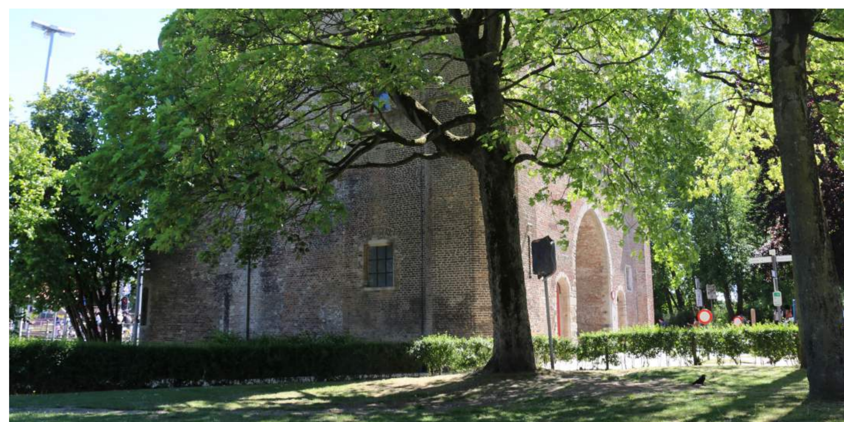
Twee foto's. Elsbes ( Sorbus torminalis ) op de Kruisvest naast de Kruispoort. De boom heeft een stamomtrek van 165 cm en werd op basis daarvan vermoedelijk geplant bij de aanplantfase van 1915.

september 2020.