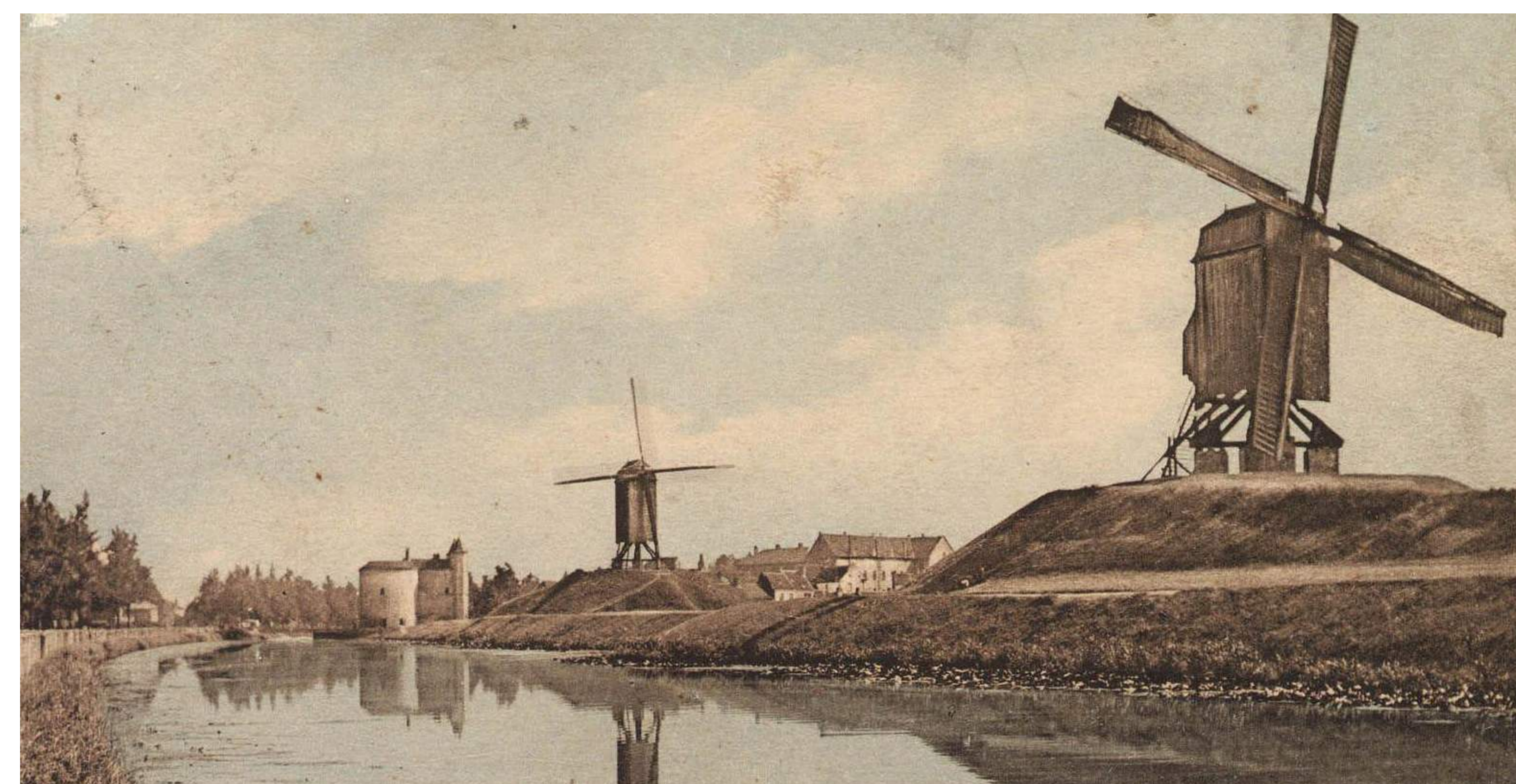
Op een prentbriefkaart van 1905 is de zone tussen de Sint-Janshuysmolen en de oorspronkelijke Bonne Chièremolen nog altijd helemaal boomvrij. De foto werd allicht vroeger genomen want een van beide molens waaide in 1904 al om.

Foto: Beeldbank Brugge, inventarisnr. FOA362