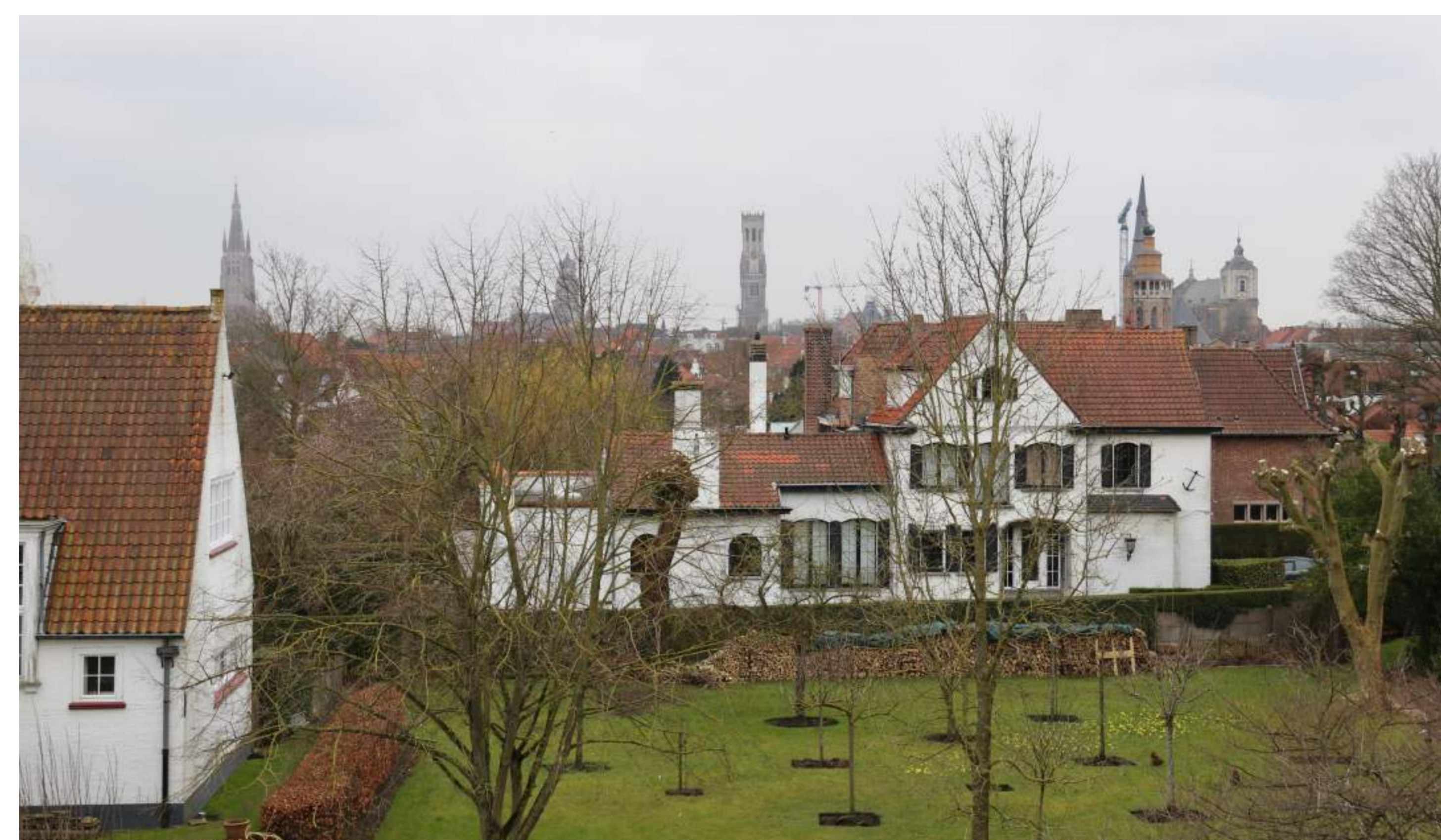
Uitzicht vanaf de molenheuvel van de Bonne Chièremolen, met van links naar rechts de toren van de Onze-Lieve-Vrouwekerk, toren van de Sint-Salvatorskathedraal, de Halletoren, de toren van de Sint-Annakerk, de toren van de Jeruzalemkerk en de toren van de Jezüetenkerk.

Bij toekomstige boomaanplantingen zullen de nog aanwezige zichtassen behouden blijven. Het is niet wenselijk om dichtgegroeide vista's te herstellen. Niet alleen zou de bomenkap te groot zijn, in veel gevallen is het oorspronkelijke uitzicht in de loop der jaren ook te veel veranderd.