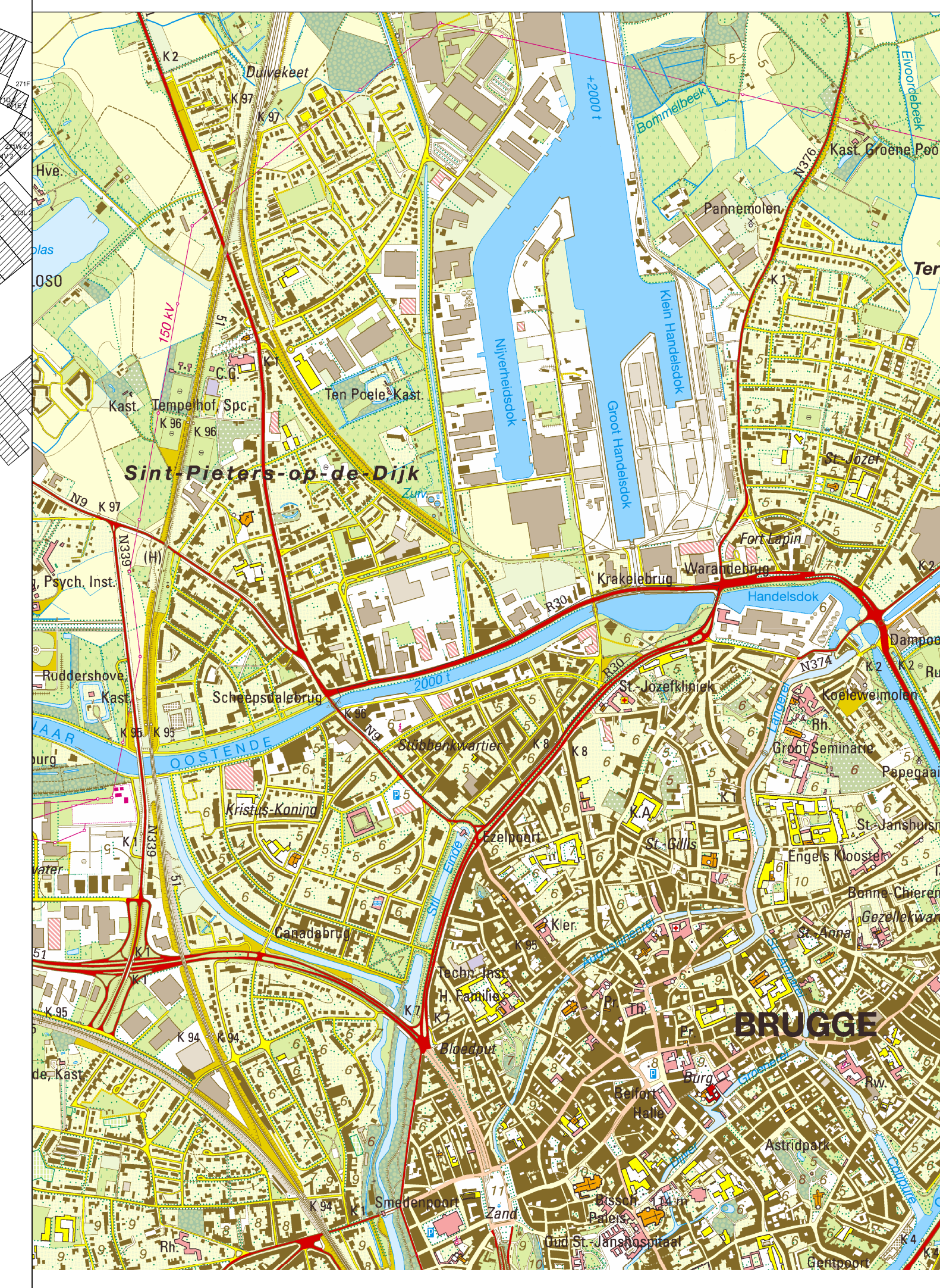
SITUATIEPLAN schaal: 1/10.000