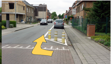
langs een hindernis fietsen