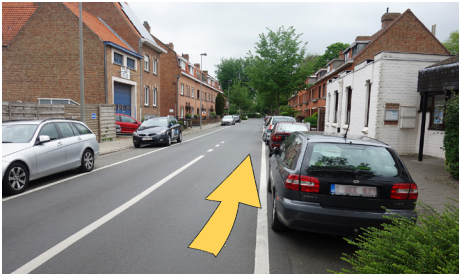
rechts op de rijbaan fietsen