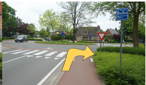
fietsen op een rotonde

Meer info over hoe je deze vaardigheden correct uitvoert en over het Grote Fietsexamen : zie website van de Vlaamse Stichting Verkeerskunde