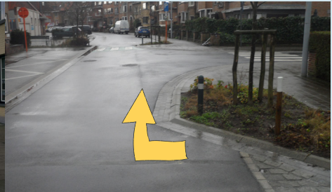
langs een hindernis fietsen