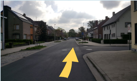
rechts op de rijbaan fietsen