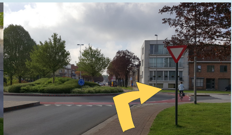
fietsen op een rotonde

Meer info over hoe je deze vaardigheden correct uitvoert en over het Grote Fietsexamen : zie website van de Vlaamse Stichting Verkeerskunde