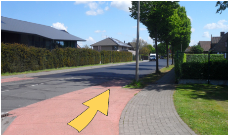
rechts op de rijbaan fietsen