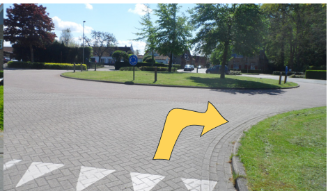
fietsen op een rotonde

Meer info over hoe je deze vaardigheden correct uitvoert en over het Grote Fietsexamen : zie website van de Vlaamse Stichting Verkeerskunde