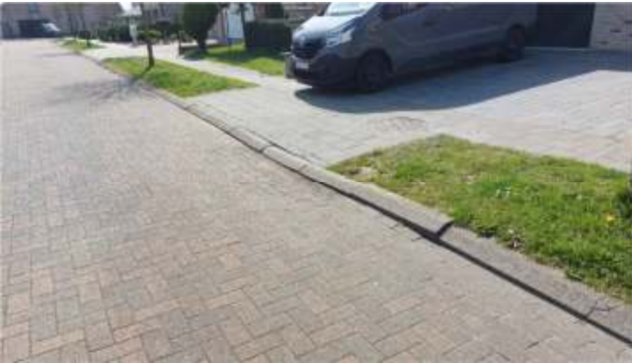
Uitstulping voetpad Tapuitstraat