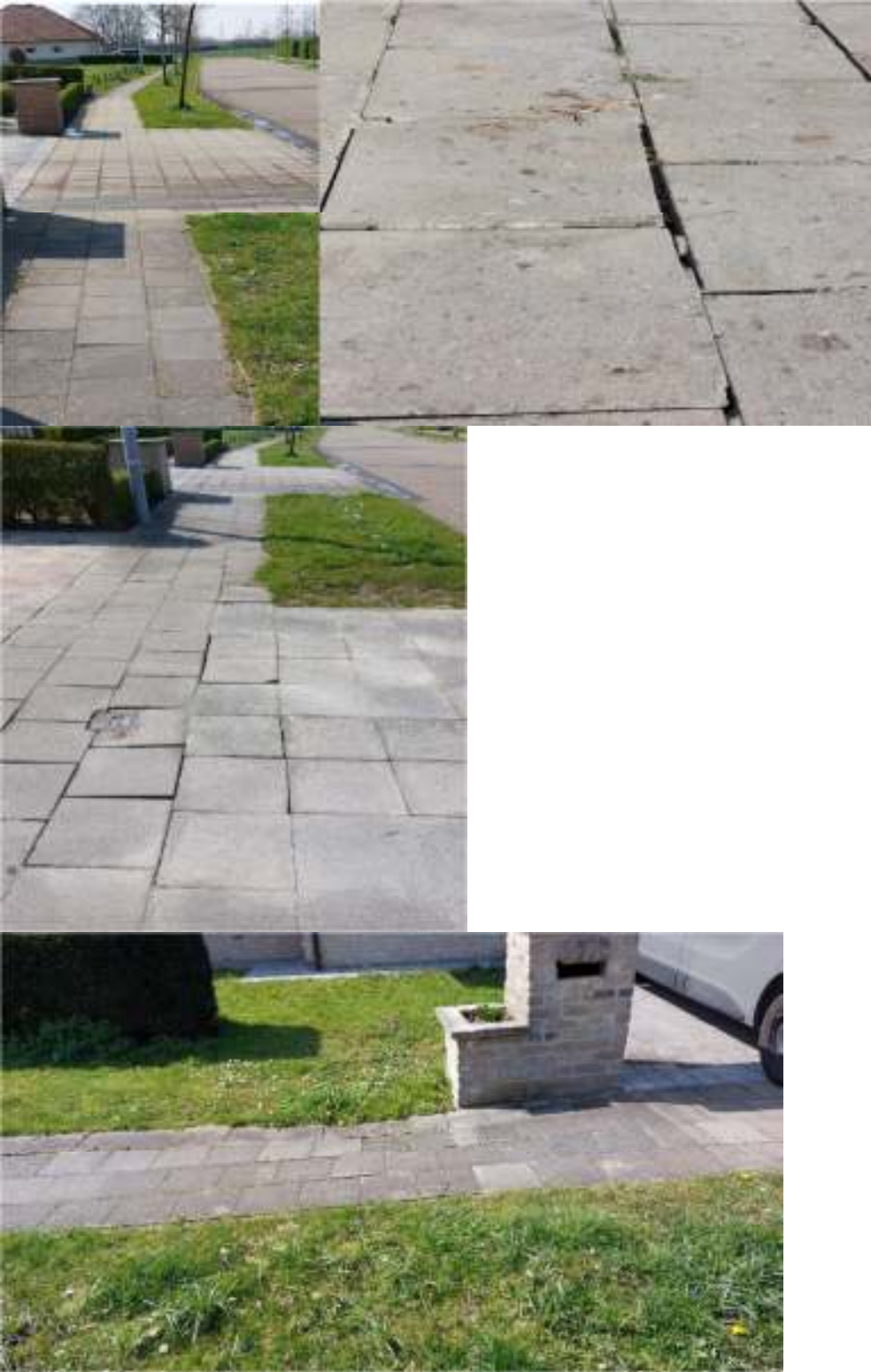
Borduur verzakt Pluvierstraat