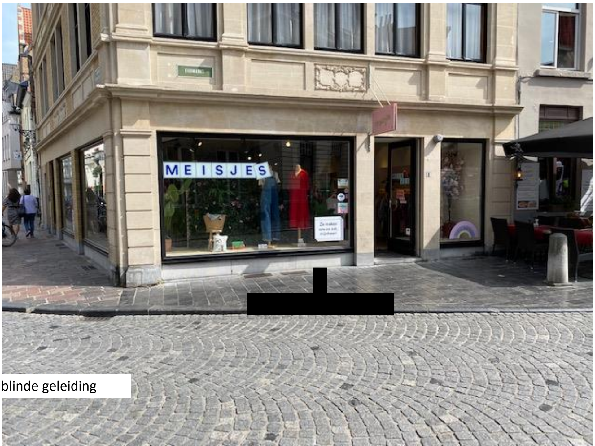
Plaatsen blinde geleiding