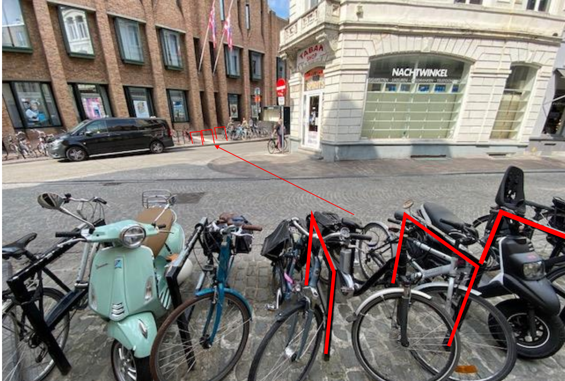
3 fietsnietjes te verplaatsen naar gemarkeerde locatie. Aan zijde Biekorf blinde geleiding weg te nemen