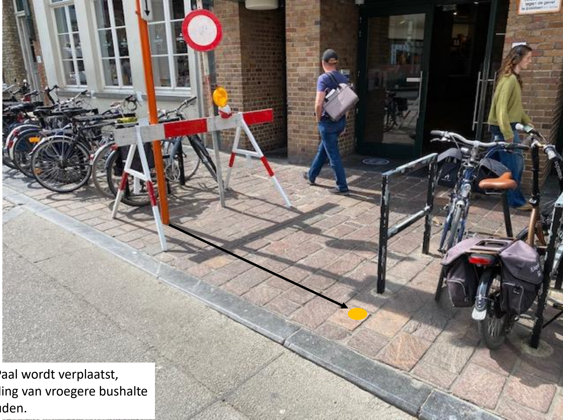
Scenario 1: Paal wordt verplaatst, blinde geleiding van vroegere bushalte wordt behouden.