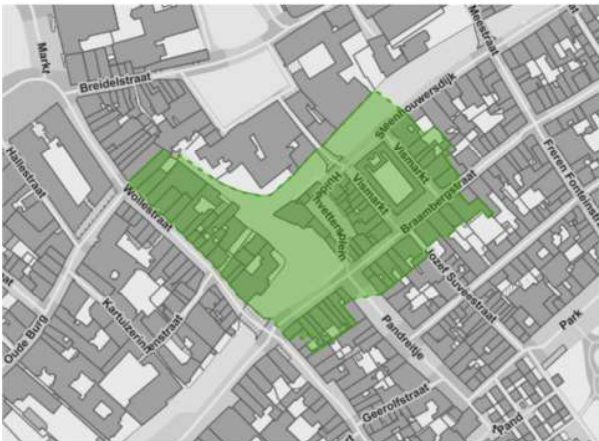
Figuur 1: Afbakening van het beschermd stadsgezicht en toepassingsgebied reglement.

Bijkomend dient voor alle zaken met betrekking tot publiciteit voldaan aan de gemeentelijke stedenbouwkundige verordening op reclames, opschriften uithangborden en andere publiciteitsmiddelen zoals goedgekeurd door de gemeenteraad dd. 31/01/2017 en eventuele latere wijzigingen.